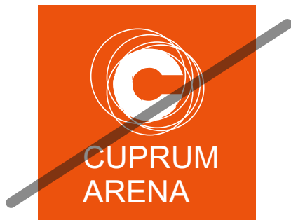
NIE zmieniaj typografii