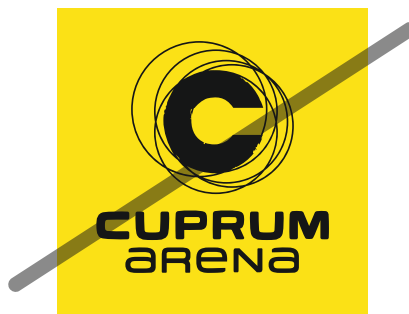
NIE zmieniaj zasad doboru kolorystycznego