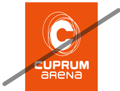
NIE zmieniaj proporcji znaku