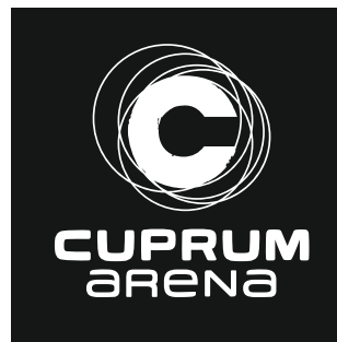
Wersja na tle ciemnym

LOGO Cuprum Arena monochromatyczne bez pomarańczowego kwadratu występuje w wyjątkowych sytuacjach. Np wycięte z folii „szron” lub stosowane w towarzystwie innych monochromatycznych znaków graficznych.