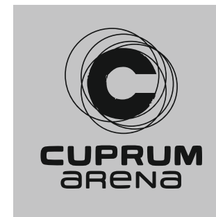
Wersja na tle jasnym

LOGO Cuprum Arena monochromatyczne bez pomarańczowego kwadratu występuje w wyjątkowych sytuacjach. Np wycięte z folii „szron” lub stosowane w towarzystwie innych monochromatycznych znaków graficznych.